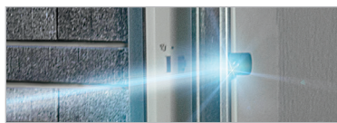
LICHTSCHRANKE FÜR GARAGENTORE

AKTION SMARTHOME STARTER-SET „HOMEMATIC IP“ INKLUSIVE LICHTSCHRANKE STATT CHF 347,- JETZT FÜR NUR CHF 220,- SPAREN SIE CHF 127,- UVP des Herstellers exklusive MwSt., ohne Montage