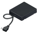
NOVOFERM HOMEMATIC IP MODUL