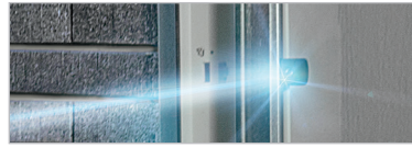
LICHTSCHRANKE FÜR GARAGENTORE

AKTION SMARTHOME STARTER-SET „HOMEMATIC IP“ INKLUSIVE LICHTSCHRANKE STATT CHF 347,- JETZT FÜR NUR CHF 220,- SPAREN SIE CHF 127,- UVP des Herstellers exklusive MwSt., ohne Montage