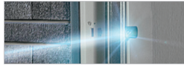
LICHTSCHRÄNKE FÜR GARAGENTORE

AKTION SMARTHOME STARTER-SET „HOMEMATIC IP“ INKLUSIVE LICHTSCHRÄNKE STATT CHF 347,- JETZT FÜR NUR CHF 220,- SPAREN SIE CHF 127,- UVP des Herstellers exklusive MwSt., ohne Montage